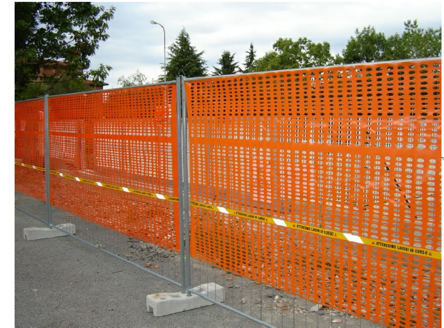
Esempio tipologico recinzione cantiere